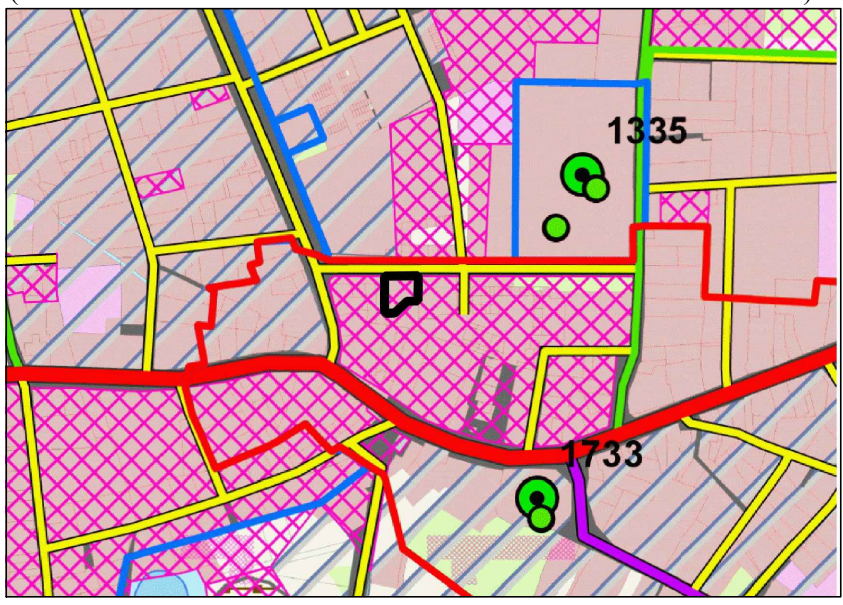
GRANICA OPRACOWANIA PLANU MIEJSCOWEGO